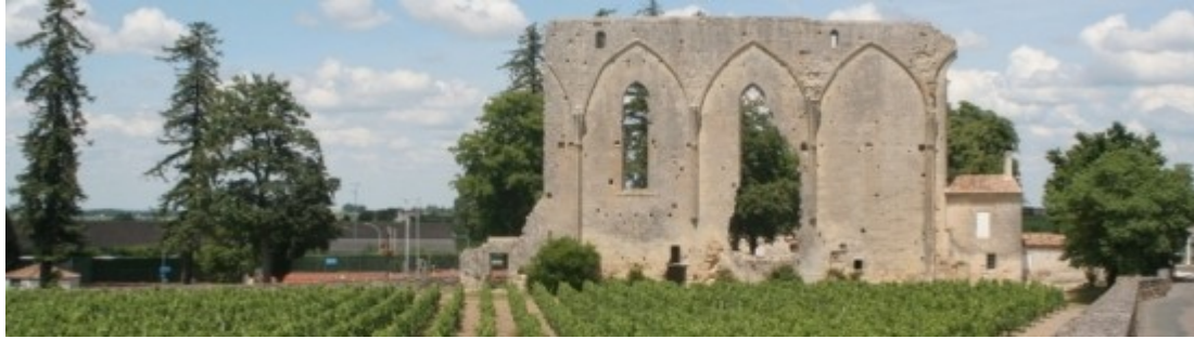
Le village de Saint Emilion classé au patrimoine mondial : les Grandes Murailles

18/18,50 - Superbe bouquet, frais, floral, très pur, rose, violette, framboise. La bouche est fraîche et tendre à la fois, soyeuse, arômes floraux, jolie texture de tanins très fins, très mûrs, une finale texturée, groseille et épices.