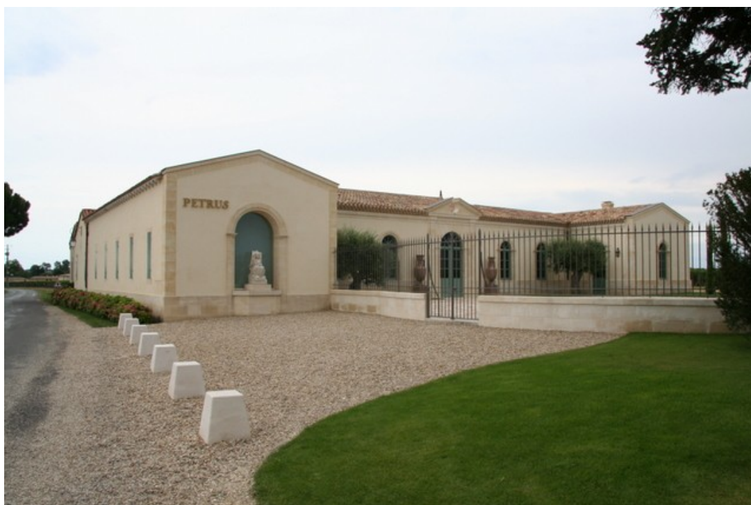
Château Pétrus à Pomerol

19- Fabuleux bouquet de toutes les fleurs blanches, biscuit, associés aux notes d'épices douces et d'agrumes. La bouche est onctueuse, fraîche, la liqueur dotée d'un "rôti" parfait, avec cette allonge finale incroyable qui laisse la bouche épanouie. Plus liquoreux (de très peu) que 2007, Yquem est une nouvelle fois éblouissant.